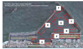
Sampling points inside the port.