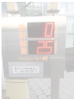
Utenfor rådhuset i Date by