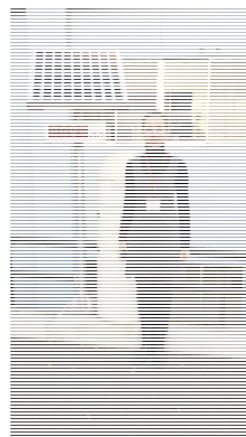
På ungdomskolen i Iwaki