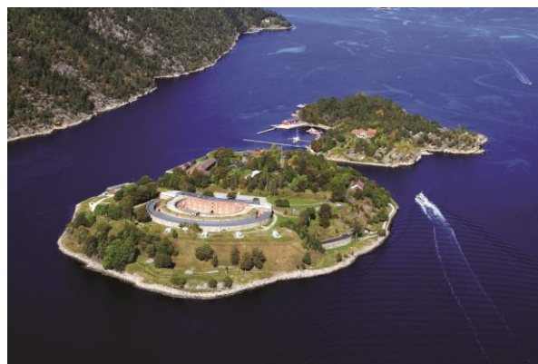
Oppstartsmøtet blir på historiske Oscarsborg festning 17. -19. april

CERAD starter opp med et stort møte på Oscarsborg festning 17. – 19. april 2013. Over 60 norske og internasjonale forskere skal i 3 dager diskutere planene for forskningen de neste 5 årene. En brukergruppe for forskningsresultatene med representanter for departementer og miljøforvaltningen, vil også delta.