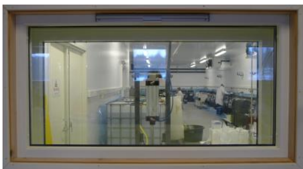
Bestrålingshallen sett fra kontrollrommet