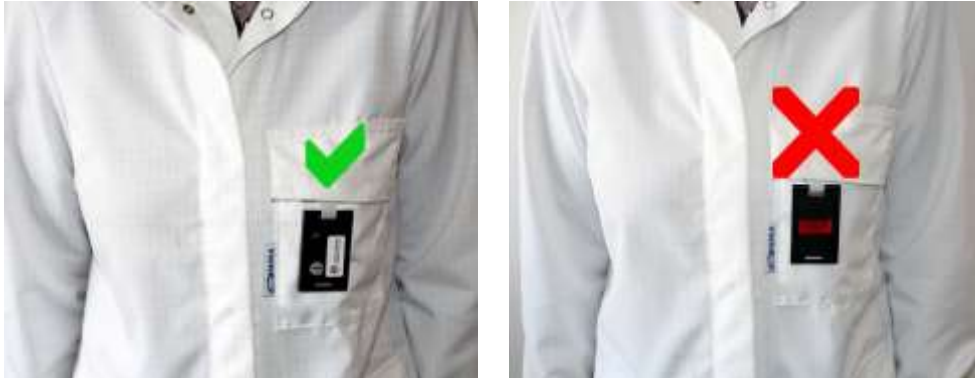
Figur 1: Bildene viser persondosimeter som vender riktig vei og feil vei.

Dosimetre skal brukes på en slik måte at de gir et mest mulig representativt bilde av bestrålingssituasjonen. Dosimeteret skal bæres slik at det vender mot strålekilden (se bildene i figur 1) og er uskjernet av en eventuell blyfrakk. Optimalt sett bør dosimeteret være plassert midt på kroppsstammen omtrent i skuldernivå.